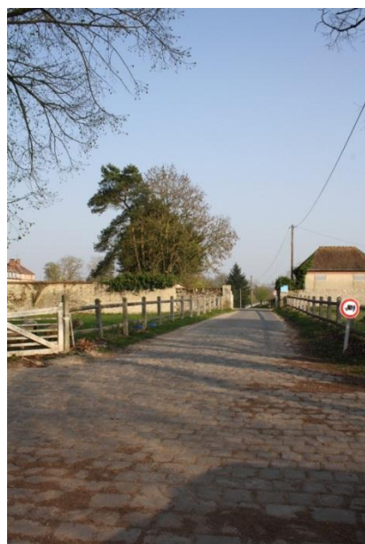
⑤ Vous poursuivez tout droit. Vous faites quelques mètres et vous prenez la 1 re à gauche