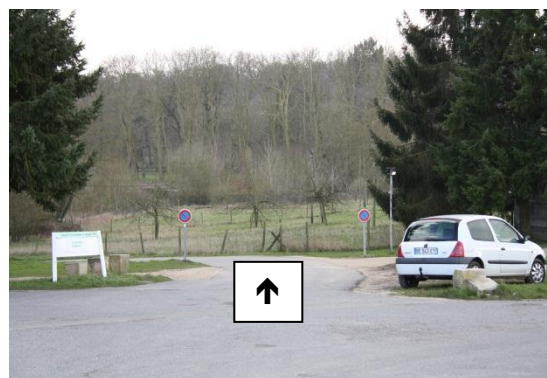
⑥ Vous poursuivez tout droit