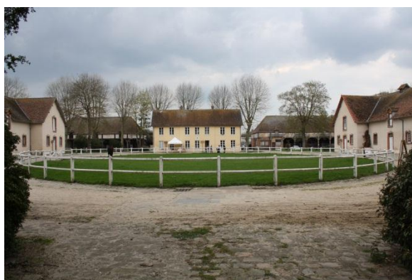
③ Les autos se garent autour de l'anneau en herbe Photos de groupe. Départ