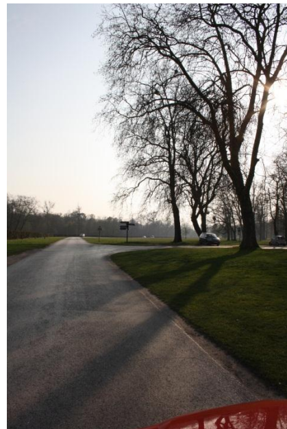
③ Dans le parc, à la 1 re intersection, prenez à droite direction « Bergerie nationale »