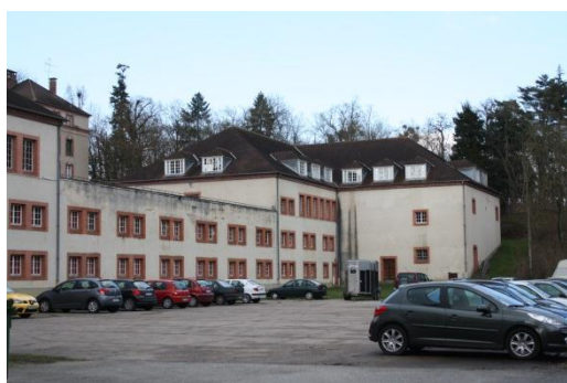
⑦ Stationnement des remorques et des autos modernes