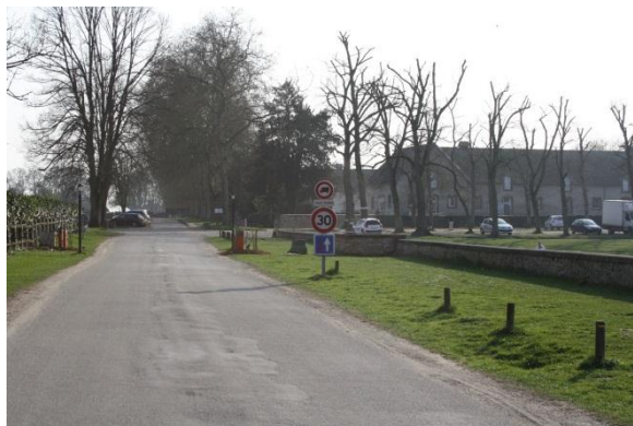
① Vers la Bergerie nationale