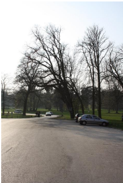
② Traversez le parc, suivez « Bergerie nationale »