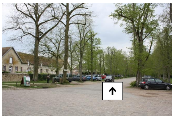
② Accès à la cour impériale