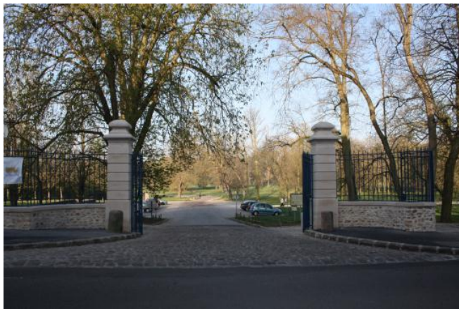
① Grille de la Motte